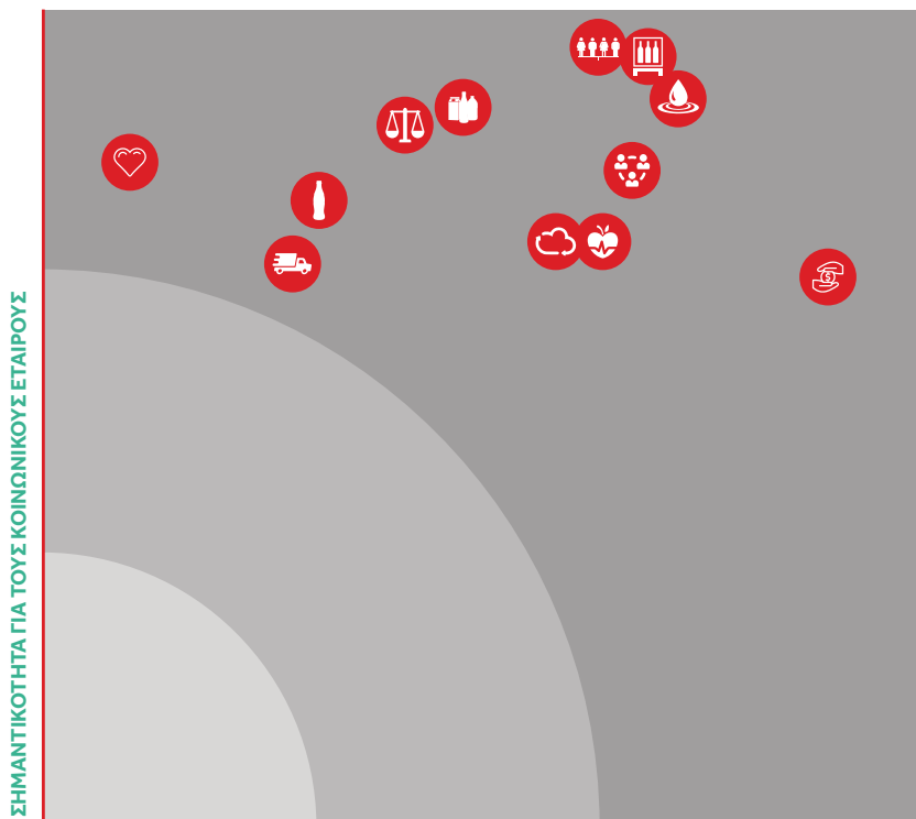
ΣΗΜΑΝΤΙΚΟΤΗΤΑ ΕΠΙΔΡΑΣΕΩΝ ΣΤΗ ΒΙΩΣΙΜΗ ΑΝΑΠΤΥΞΗ

Τα όρια επίδρασης του κάθε ουσιαστικού θέματος παρουσιάζονται ξεχωριστά στο αντίστοιχο κεφάλαιο της Έκθεσης σε σχέση με την αλυσίδα αξίας μας.